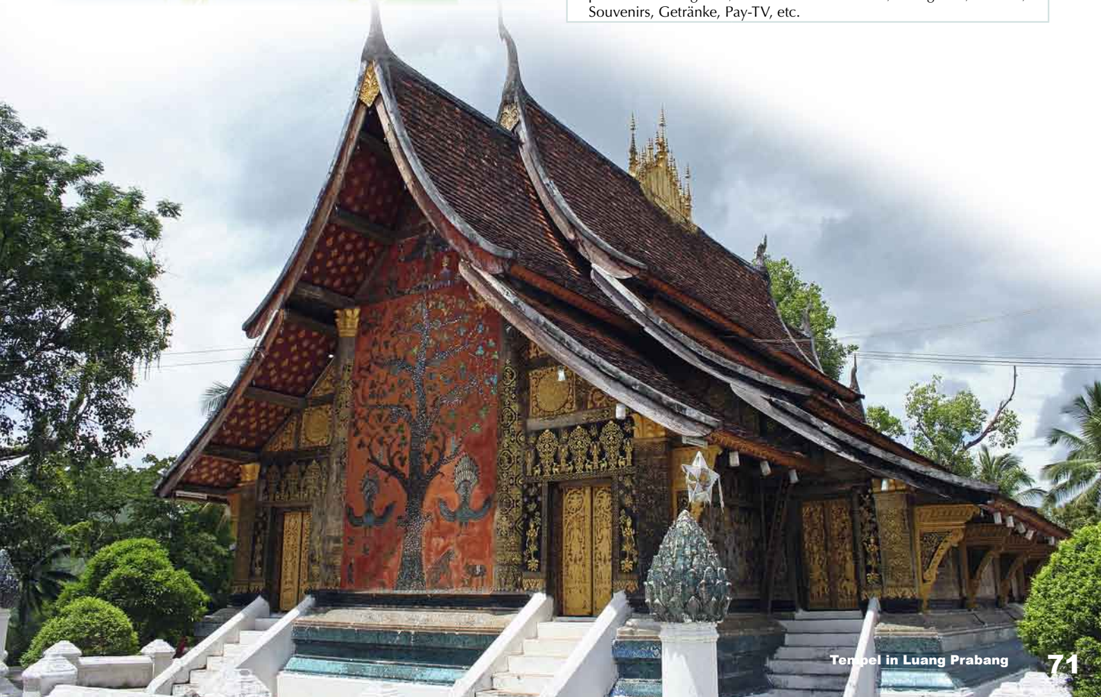
Tempel in Luang Prabang